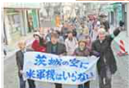
す 対 反 に

なんでもアメリカ力言いなりの自民、公明政権は、米軍戦闘機の訓練を日本各地に移転させようとしています。これ