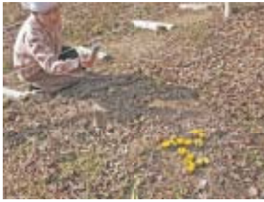
あかね平の福寿草