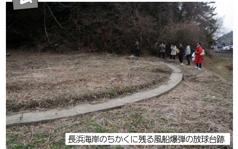
長浜海岸のちかくに残る風船爆弾の放球台跡