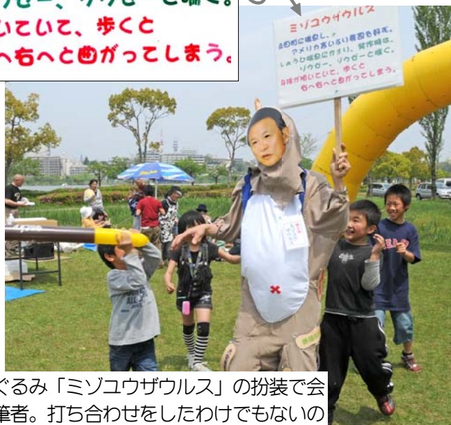
手作りの着ぐるみ「ミソコウザウルス」の扮装で会場入りした筆者。打ち合わせをしたわけでもないのに、子どもたちに袋だたきにされてしまいました。

永田町に橋息し、 アメリカ言いなり寿司も好き。 しょうひ喘息にかかり、発作時は、 ゾウゼー、ゾウゼーと喘ぐ。 身体が傾いていて、歩くと 右へ右へと曲がってしまう。